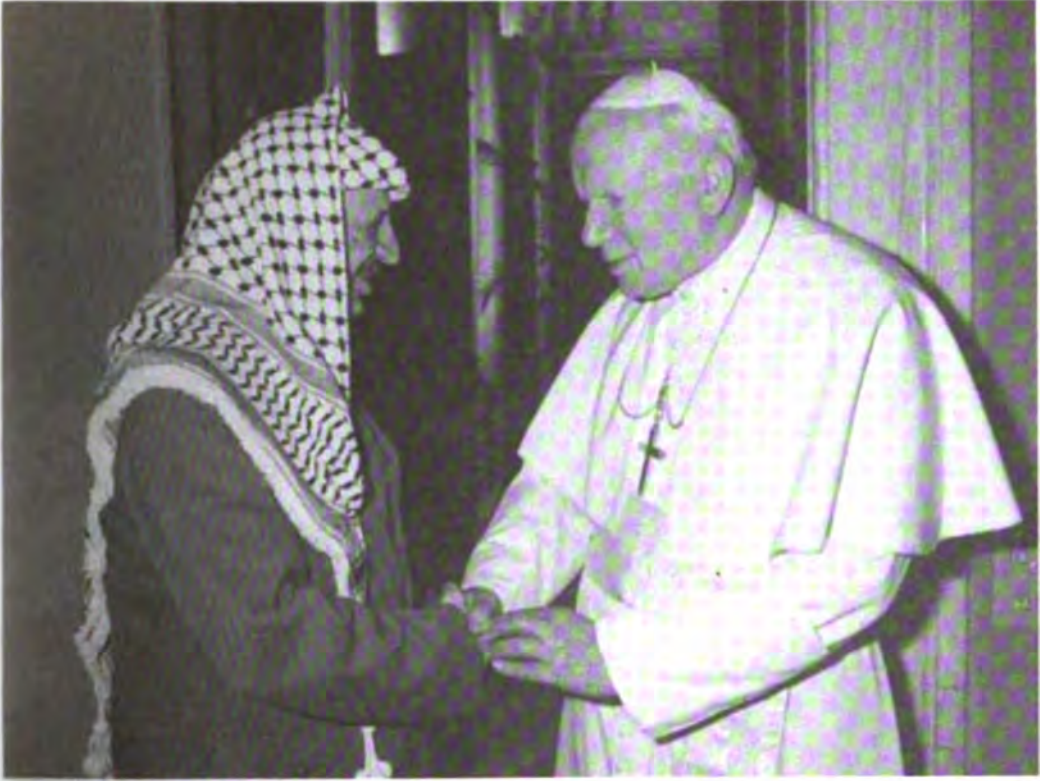
مع البابا يوحنا بولس الثاني